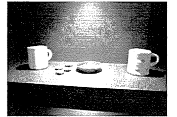
◇素敵な作品と製作の様子◇