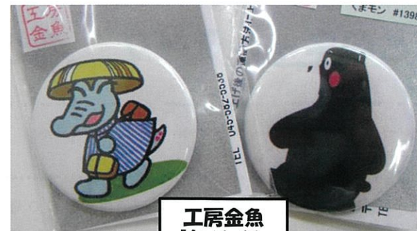
工房金魚 「缶バッジ」