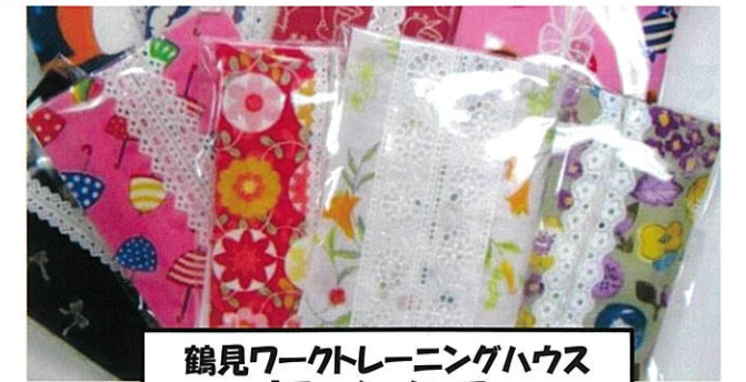
鶴見ワークトレーニングハウス 「ティッシュケース」