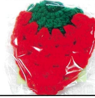
一歩舎 1・2号館/3号館 「エコたわし」