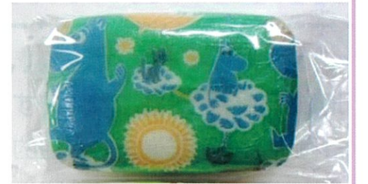
Peace 「せっけんのエコパージュ」