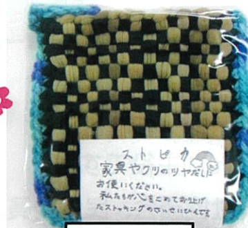
もとみや 「ストピカ」