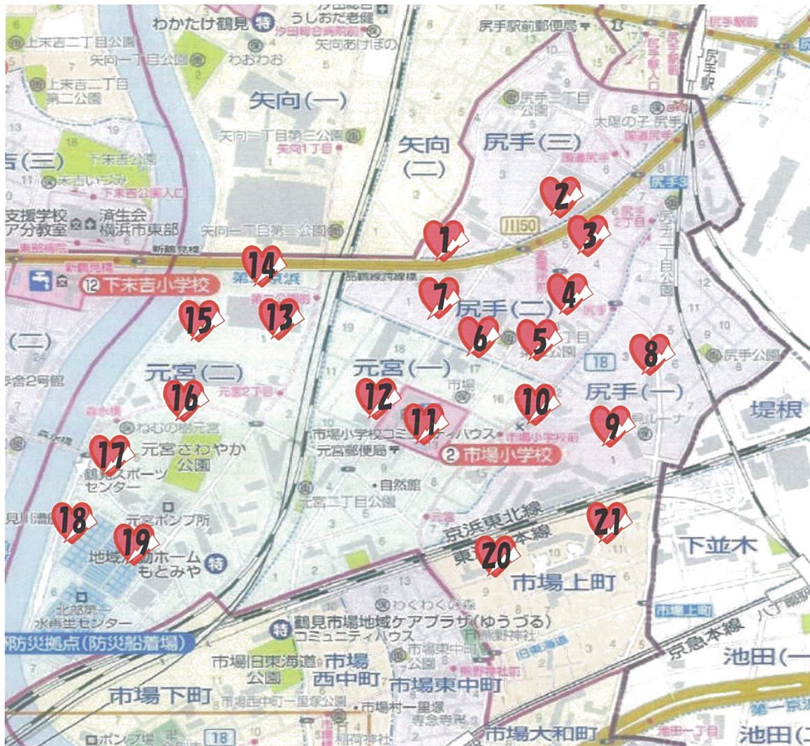
日本全国 AED マップ参照

この広報紙は、市場第2地区に住んでいる皆さんの「地域のことを知ってほしい」や「交流の輪を広げたい」そんな声から作られました。