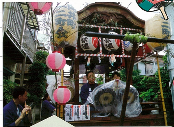
向井町1、2丁目の様子です。今年も潮田囃子保存会の皆様のお囃子のもと、山車を引く子供たちも楽しげでした。

梅雨入りしたばかりの曇天のなか、潮田神社例大祭が執り行われました。7日土曜日は大雨警報が発令され一部の町会では、お神輿にビニールを巻き雨支度をして待機をしていました。日曜日は朝のうちこそ雨模様でしたが潮田パワーにより何とかメインのパレードも実施され、盛大に、元気に行われました。大きな事故などもなく大勢の人の行き交うなか、それぞれの町会の特色を出し楽しく今年もお祭礼を満喫したようです。