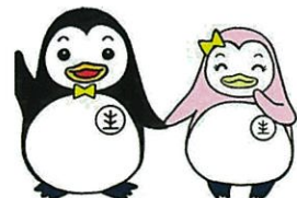
更生保護のマスコットキャラクター 更生ペンギンのホゴちゃんとサラちゃん

安全で安心な暮らしはすべての人の望みです。犯罪や非行をなくすためには、どうすればよいのでしょうか？ 取り締まりを強化して、罪を犯した人を処罰することも必要なことです。しかし、立ち直ろうと決意した人を社会で受け入れていくことや、犯罪や非行をする人を生み出さない家庭や地域づくりをすることもとても大切なことです。立ち直りを支える家庭や地域をつくる。そのためには一部の人たちだけではなく、地域のすべての人たちそれぞれの立場で関わっていく必要があります。