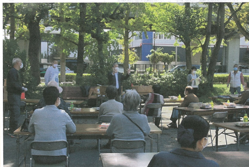
左中・下会食参加者 右下お弁当