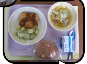
横浜市の姉妹都市 リヨンにちなんだ メニューでした！