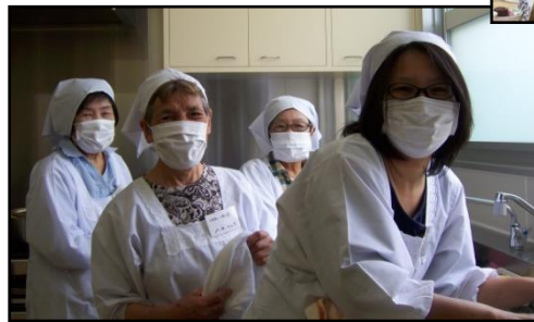
準備も手際良く和気あいあい♡