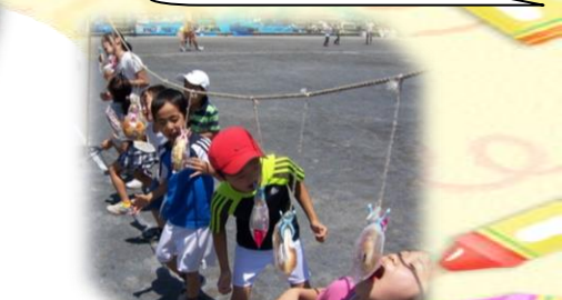
連合大運動会も地区社協の助成事業です

そのほか、青少年指導員会・スポーツ推進委員会・老人連合会・こども育成会・民生委員児童委員協議会の各委員会の活動も助成しています