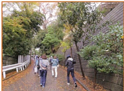
神明社→師岡熊野神社→横溝屋敷を巡る健歩会約100名強の参加でした

6) ふれあい茶話会を令和元年10月9日参加者11名で行いました。 3月11日開催予定の茶話会は新型コロナウイルス感染症対策で地区センター休館の為中止としました。