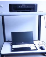
パソコン(備付) ※資料作成のみ使用可