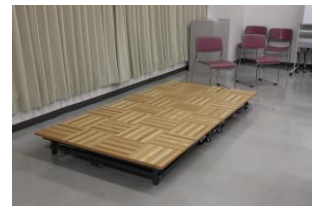
折り畳み式ステージ台