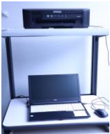
パソコン(備付) ※資料作成のみ使用可