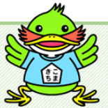
駒岡地域ケアプラザの マスコットキャラ「こまきち」

駒岡地域ケアプラザがどんなところか、どんな事をやっているか、ご紹介しています。第3回目のテーマは、「地域包括支援センター」についてです。