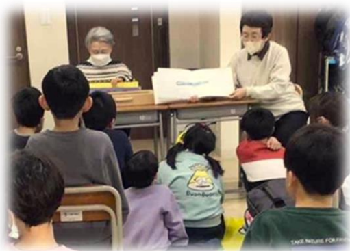
放課後デイサービスでの活動

「もりの木」は、依頼を頂いた「わっくん広場」「盲特別支援学校」「放課後等デイサービス」などに出向いて、絵本や紙芝居の読み聞かせをしています。平成 16 年（2004 年）に活動を開始。まだ言葉がわからないはずの 1 歳未満の赤ちゃんでも、読む人の方をしっかりと見て、擬音語や絵本の色彩を楽しんでくれます。