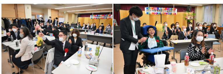
音楽演奏で会場はノリノリ。終始和やかなムードでした