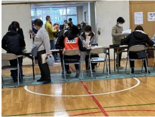
受付をしてから 体育館内に入ります