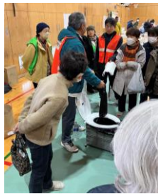
仮設トイレ 組み立ての様子