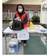
ペットの会のみなさんも 参加しました！