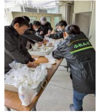
炊き出し訓練を 行いました