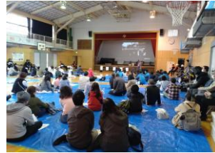
防災拠点開設・運営マニュアル の動画視聴をしました