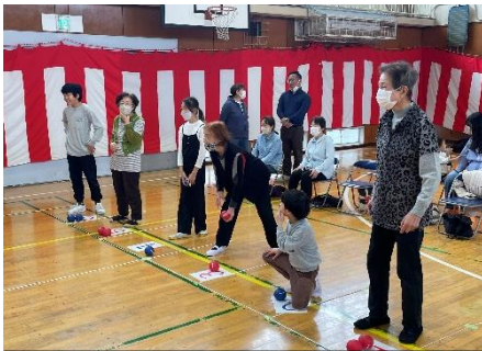
ポッチャで交流しました★

3月28日(土)、春の「生麦学び遊び場の会」が生麦小学校の体育館にて行われました。18名の小学生が参加し、ポッチャ、フリスビーを用いた的当て、なまいちじゃんカルタで遊びました。今回は、生麦地域ケアプラザにて開催されている自主事業「いきいきひろば」で日頃からポッチャをプレーしている高齢者の皆さんとのコラボレーションも実現しました。いきいきひろばからは、5名の方に参加をしていただき、ポッチャを通じた世代を超えた交流が生まれていました。フリスビーを使った的当てでは、子どもたちが協力し合い、どれだけ早くコンプリートできるかを挑戦していました。子どもも大人も、終始盛り上がった様子でした。次の学び遊び場の会は夏休み期間（7月下旬ごろ）を予定しています 🌻