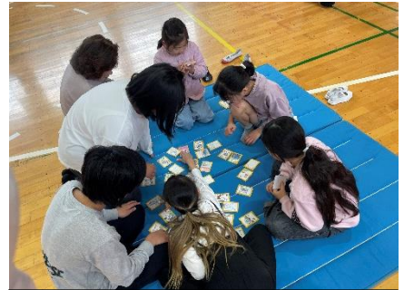
白熱のなまいちじゃんカルタ