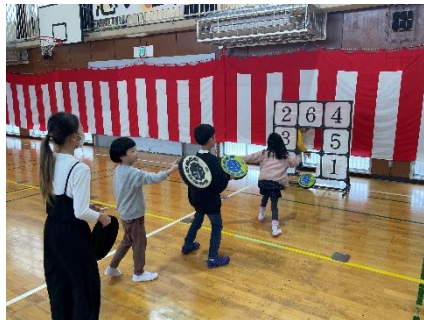
フリスビーでスピード競争！